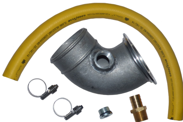
KIT DE CONVERSIÓN DE CODO MIDC285-8823K , CAT N270/EL365, C-15

Accupart ofrece ahora una solución a este problema mediante un kit de conversión que le permite cambiar la entrada del compresor a presión positiva utilizando el aire de turbo del motor que alimenta la entrada del mismo. Algunos reconstructores de hoy lo están haciendo un cambio obligatorio como parte de la oferta de garantía del compresor de aire. Solicite sus kits hoy y evite que el compresor de sus clientes bombee aceite de forma permanente.